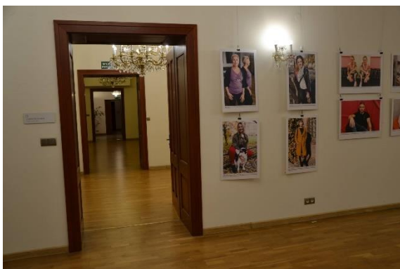
Zleva: Prostor pro návštěvníky, výtah, komunikační cesty