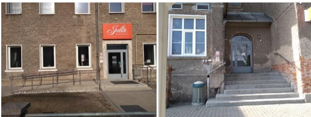
Haupt- und Seiteneingang (Kasse, Café, Laden mit Farbglas)