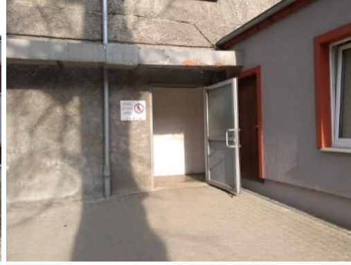
Haupteintritt zur Hütte Besichtigung und der barrierefreie Eintritt für Menschen mit eingeschränkter Mobilität