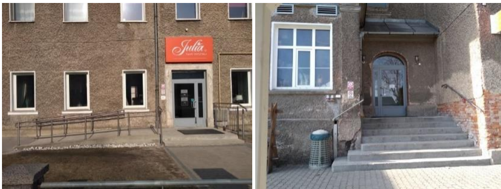
Hlavní vstup a boční vstup (pokladna, kavárna, obchod s barevným sklem)