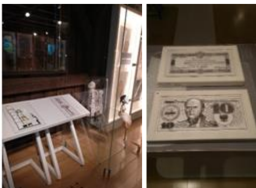
Reliéfni kopie vybraných exponátů