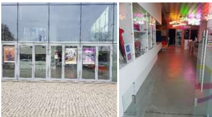
Wejście do budynku Amfiteatru, wejście do muzeum