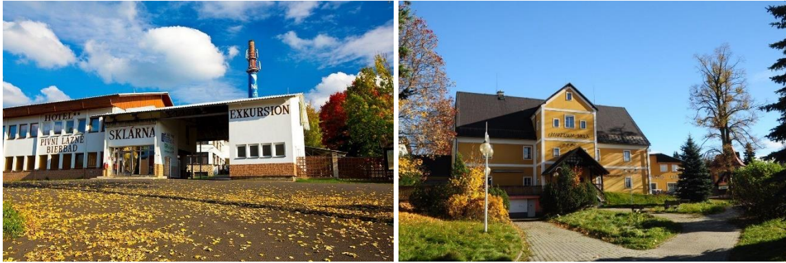
Von links: Eingang Rezeptionsgebäude, Museum