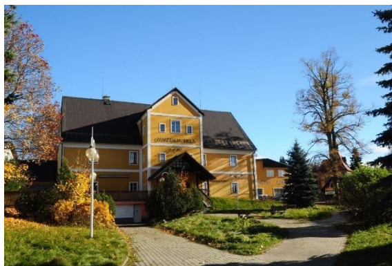
Zleva: Vstup do recepční budovy, objekt muzea