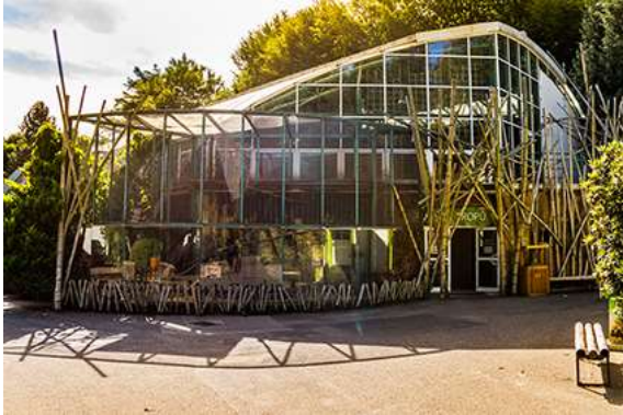
Wejście do pawilonu tropików