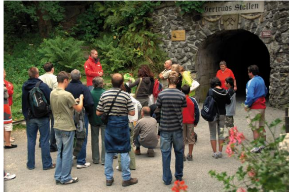
Zleva: Místo setkání s průvodcem, hlavní náměstí, vstup do štoly Gertruda