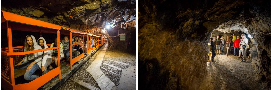
Zleva: podzemní oranžová tramvaj, štola Černá