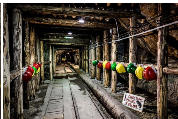
Zleva: Skluzavka ve štole Gertruda (toto místo prohlídky lze obejít), vstup na podzemní sjezd lodí