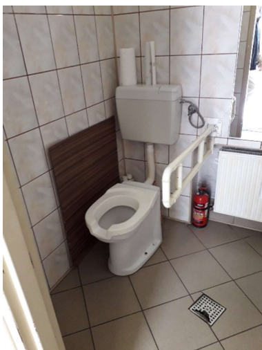
Veřejné WC - ul. Ratuszowa