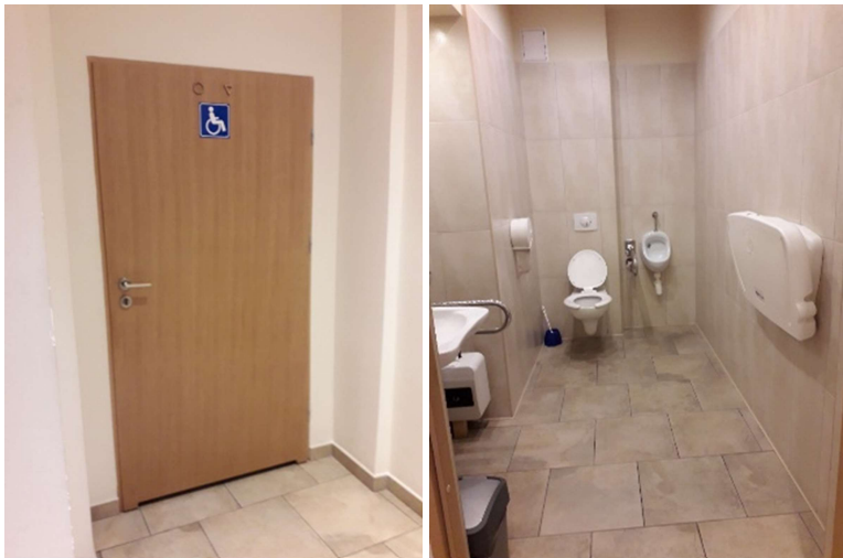
Bezbariérová toaleta na radnici