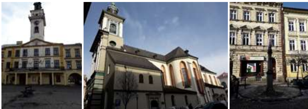
Zleva: Náměstí – Radnice, kostel sv. Marie Magdalény, Madona s dítětem

Trasa pokračuje z náměstí dolů po ul. Głęboka (Hluboká) a pak druhou ulicí vpravo na náměstí Stary Targ (Starý trh) k Madoně s dítětem. Ulicí Aleksandra Fredry dojdete k divadlu A. Mickiewicze a po ul. Plac Teatralny a Mennicza k Těšínské knihovně (Książnica Cieszyńska). Po ul. Mennicza se vraťte zpět na ul. Głęboka. Můžete sejít ještě kousek dolů k Muzeu tisku (Muzeum drukarstwa) nebo se vydat nahoru do kopce a první ulicí vpravo (ul. Browarna), na jejím konci vlevo (ul. Śrutarska) a dojdete ke studni Tří bratří. Poté pokračujte po ul. Śrutarska a Nowe Miasto až na křižovatku s ul. Limanowskiego, po které dojdete kolem Parku míru a ul. Tadeusza Regera zpět na náměstí.