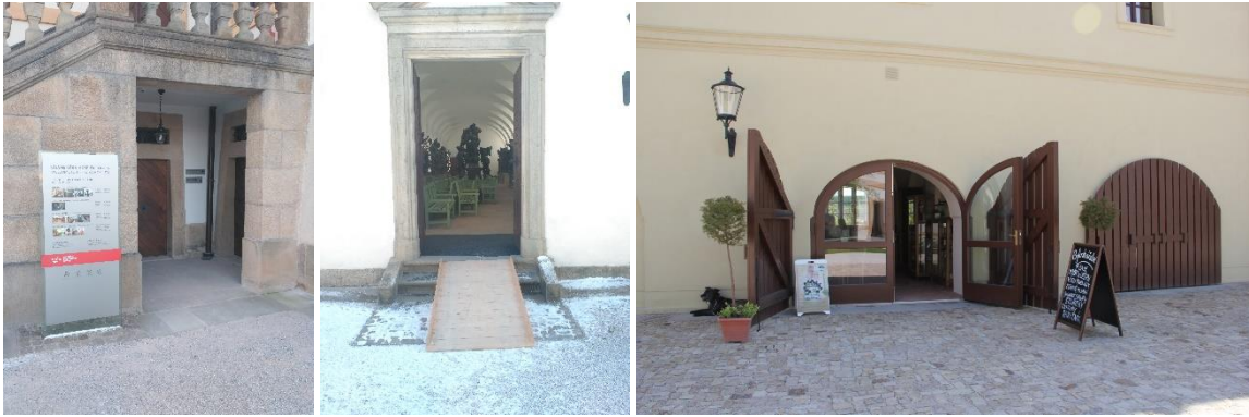
Zleva: Vstup pokladna, vstup lapidárium, vstup bylinkářství