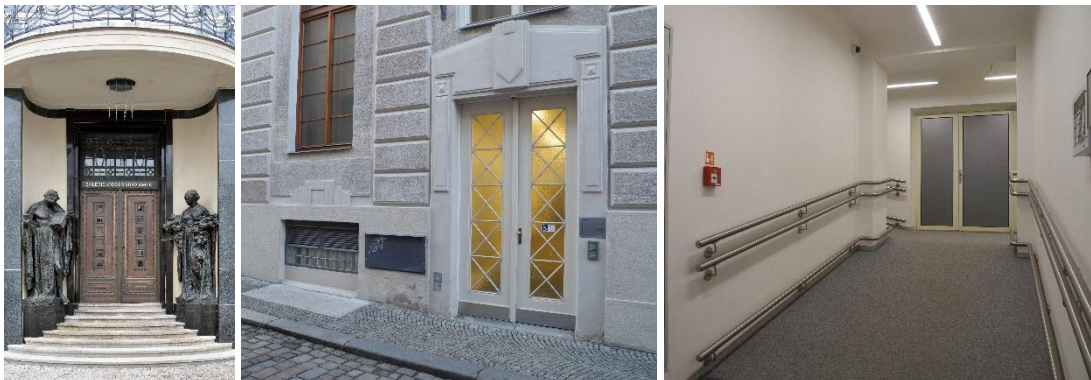
Zleva: Hlavní vstup, boční vstup, rampa u bočního vstupu