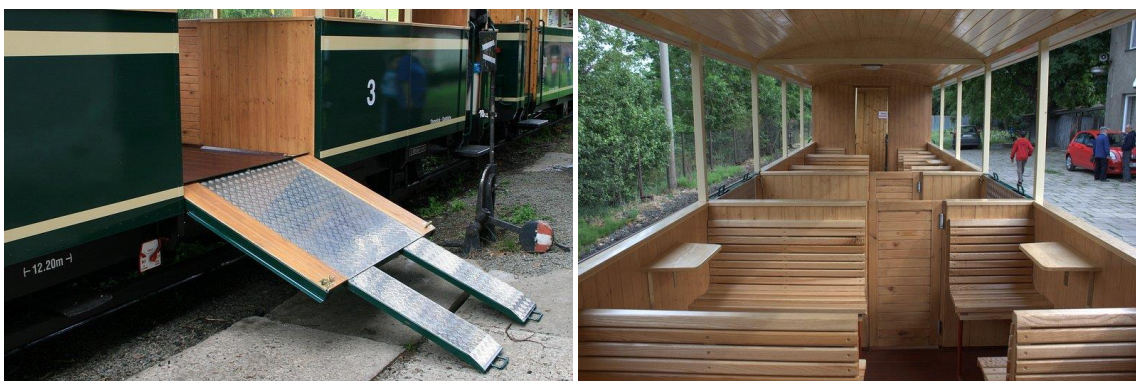
Zleva: Vyklápěcí plošina a interiér vozu pro přepravu imobilních osob