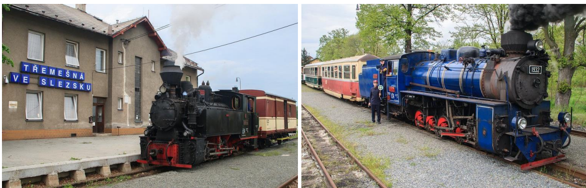
Zleva: Nástupiště v Třemešné a v Osoblaze