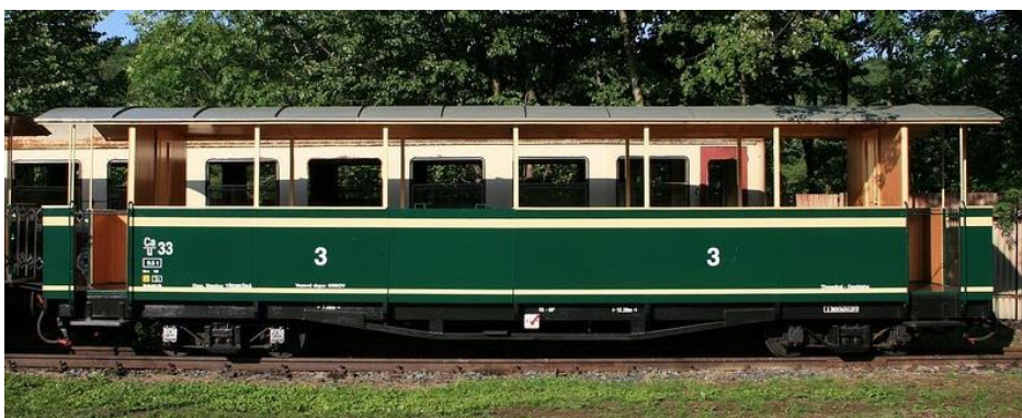
Výletní vůz pro přepravu imobilních osob