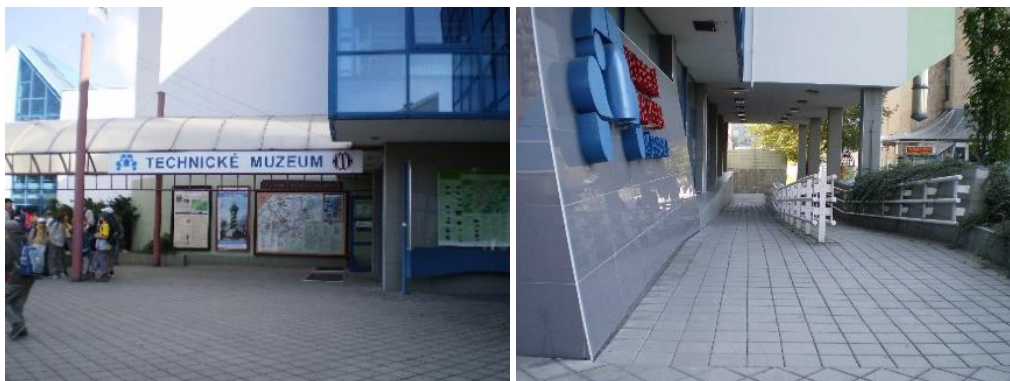
Zleva: Plocha před vstupem do muzea, nájezdová rampa na přístupové cestě k muzeu