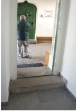
Von links: Schlosseingang, Treppenhaus und Stufen auf dem Besichtigungsrundgang