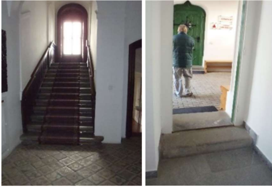
Von links: Schlosseingang, Treppenhaus und Stufen auf dem Besichtigungsrundgang