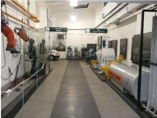
Od lewej strony: Wejście do szatni łańcuskowych, wewnątrz wystawy ratownictwa górniczego