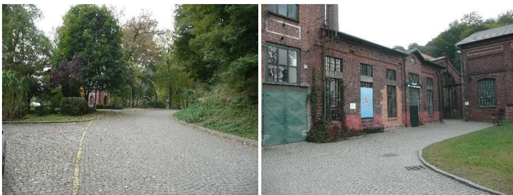
Od lewej strony: Dojście z parkingu, dostęp do kasy