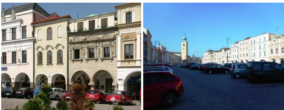
Zleva: Dům U Rytířů (začátek trasy), Smetanovo náměstí