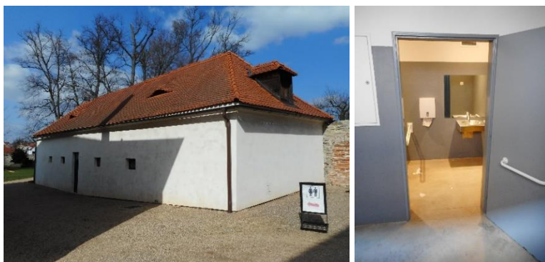
Zleva: Budova WC v zámeckém areálu, vstup do bezbariérové WC kabiny v zámeckém areálu