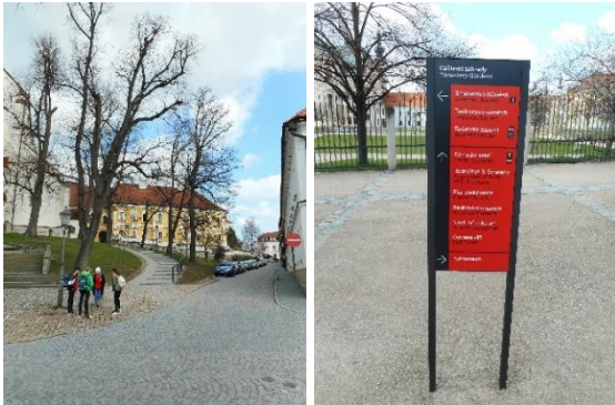
Zleva: Kostel povýšení a cesta k náměstí, značení ve městě