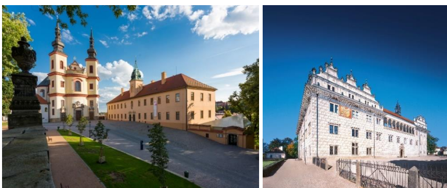
Zleva: Zámecké návrší, zámek