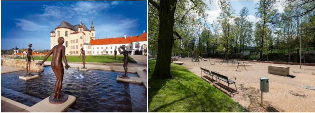
Zleva: Klášterní zahrady, park Vodní valy