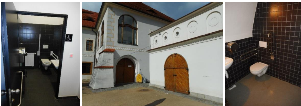
Zleva: WC Smetanovo náměstí, budova WC v Klášterních zahradách, WC v Klášterních zahradách