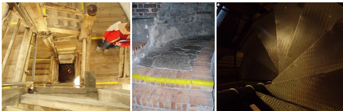
Schodiště uvnitř Trúby