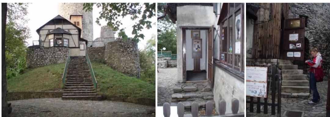
Zleva: Přístup k hradu, vstup do pokladny, vstup na Trúbu