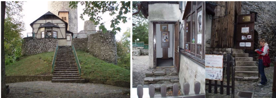
Von links: Zugang zur Burg, Kasseneingang, Eingang zu Trúba