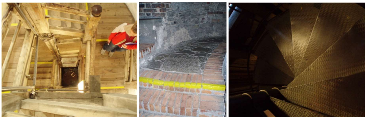
Treppenhaus im Inneren der Trúba