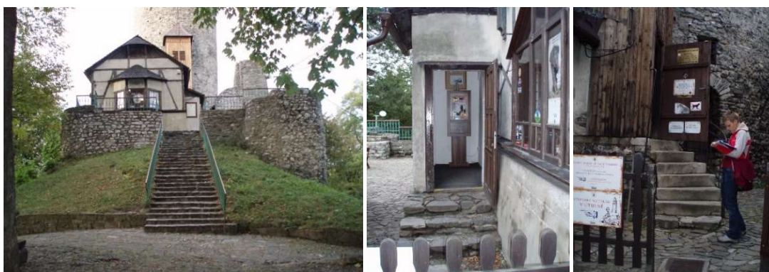
Zleva: Přístup k hradu, vstup do pokladny, vstup na Trúbu