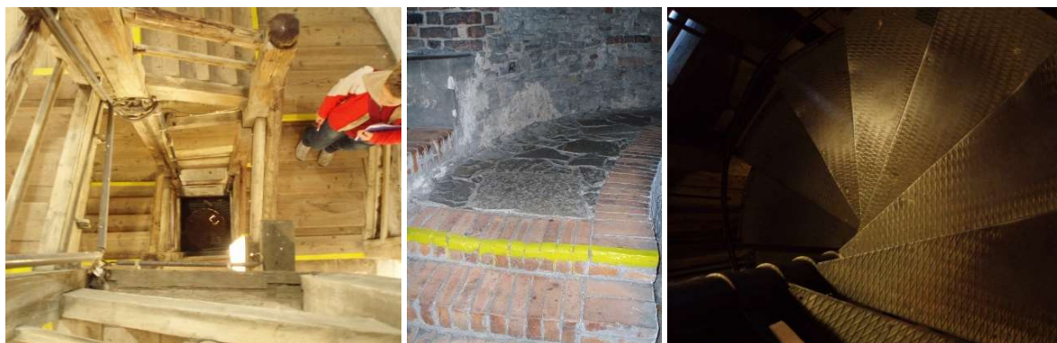
Schodiště uvnitř Trúby