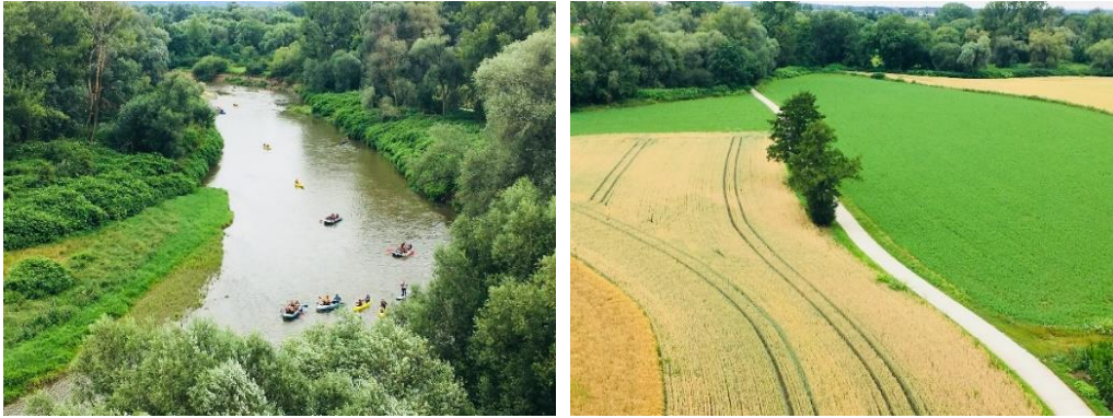
Aussicht aus dem Turm