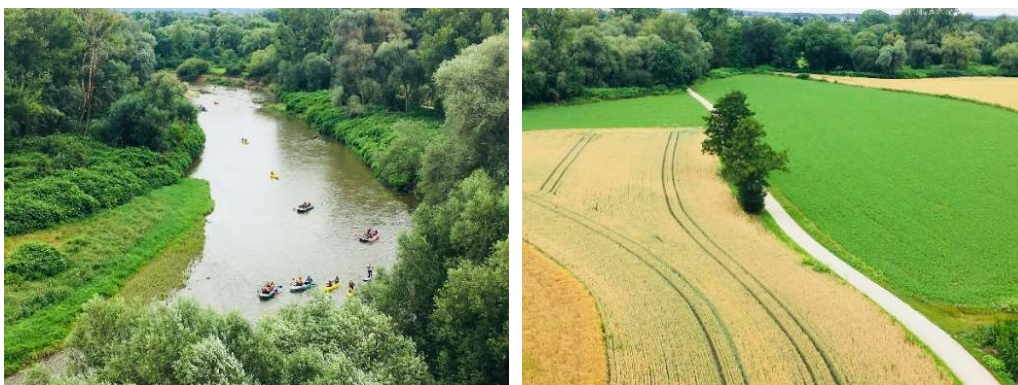
Výhled z věže