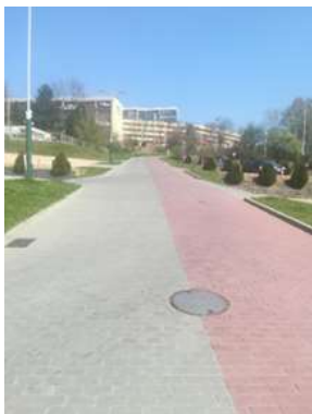
Hlavní vstup od parkoviště (ul. Matuszczyka)