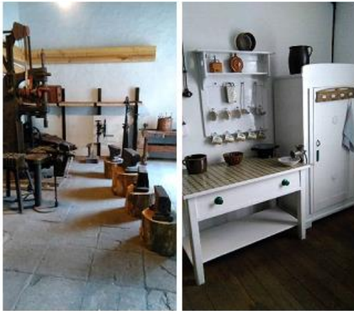
Von links: Schmiedewerkstatt, schlesische Stube