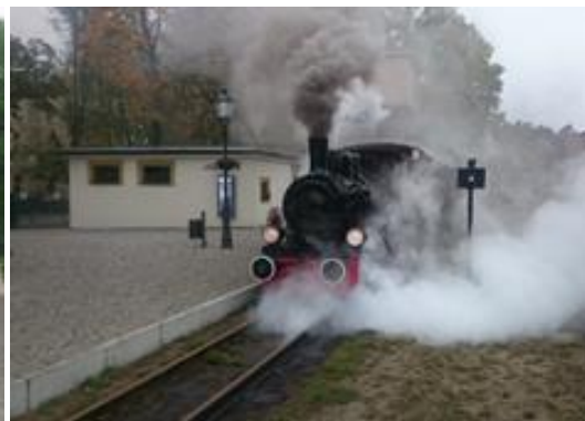
Station in Groß Rauden