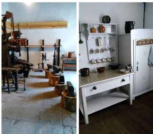
Zleva: Kovárna, slezská jizba