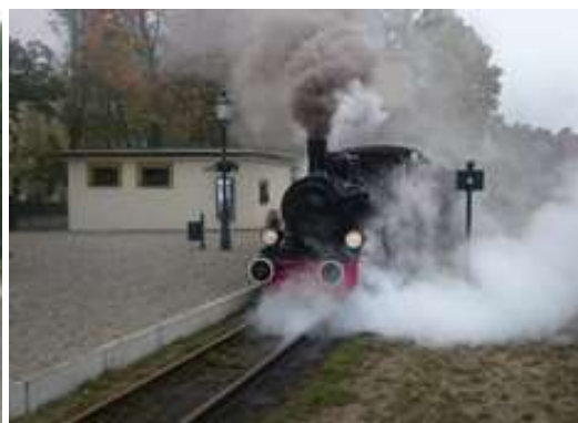
Stanice v Rudach